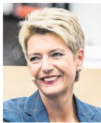
Bundesrätin Karin Keller-Sutter.

Ist das jetzt ein guter Kompromiss – oder ein Kuhhandel, der kein Problem löst? An dieser Frage schieden sich gestern die Geister. Im Ja-Lager trat unter anderem der Hausherr, Stadler-Rail-Chef Peter Spuhler, an. Seine Partei, die SVP, hat zwar Stimmfreigabe beschlossen. Doch der